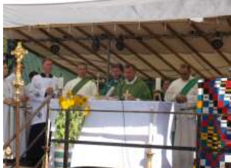
2016 FKB-Festgottesdienst auf dem Schosplatz

Festplatz am Schloss ein. Der Chor „Sing mit“ und der Chor AmiCanta werden den Gottesdienst mitgestalten. Die Kollekte ist für die Projekte in Togo, Indien und Brasilien. Besuchen Sie in der Schlosshalle auch den Flohmarkt und die Ausstellung zum 50. FKB.